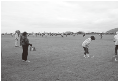
グラウンドゴルフ大会の様子